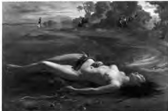
MEIRELLES, V. Moema . Óleo sobre tela, 129 cm x 190 cm. Masp, São Paulo, 1866.

Disponível em: www.masp.art.br . Acesso em: 13 ago. 2012 (adaptado).