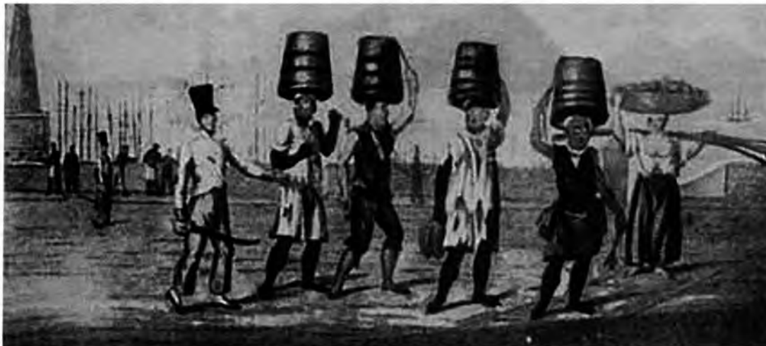
EIGENHEER, E. M. Lixo: a limpeza urbana através dos tempos . Porto Alegre: Gráfica Palloti, 2009.