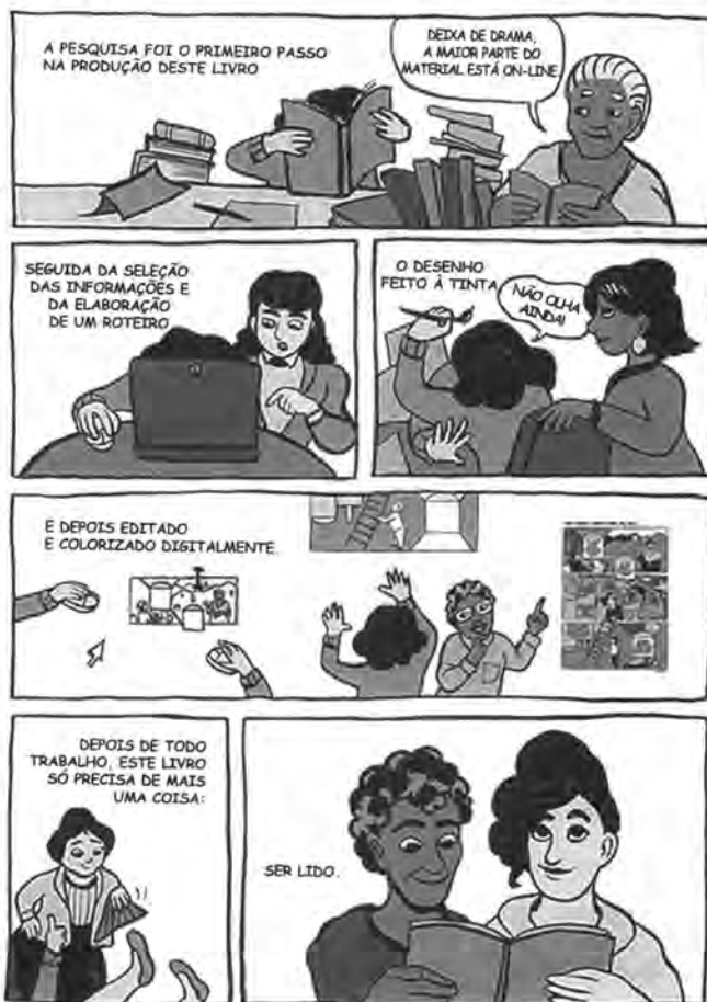
LEMOS, A. Artistas brasileiras. Belo Horizonte: Migulim, 2018.

O que assegura o reconhecimento desse texto em quadrinhos como prefácio é o(a)