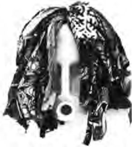
HAZOUMÉ, R. Nanawax . Plástico e tecido. Galerie Gagosian, 2009.

Disponível em: www.actuart.org. Acesso em: 19 jun. 2019.