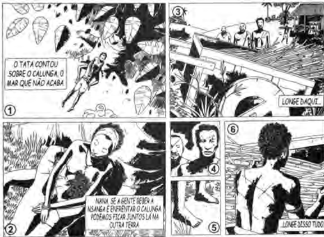
D'SALETE, M. Cumba. São Paulo: Veneta, 2018, p. 10-11 (adaptado).

A sequência dos quadrinhos conjuga lirismo e violência ao