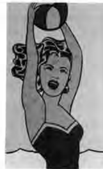
LICHTENSTEIN, R. Garota com bola . Óleo sobre tela, 153 cm x 91,9 cm. Museu de Arte Moderna de Nova York, 1961.

Disponível em: www.moma.org . Acesso em: 4 dez. 2018.