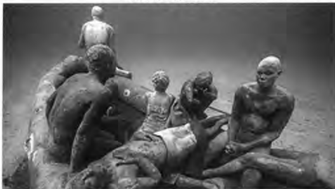
TAYLOR, J. C. A balsa de Lampedusa . Instalação. Museu Atlântico, Lanzarote, Canárias, 2016 (detalhe).

A crise dos refugiados imortalizada para sempre no fundo do mar